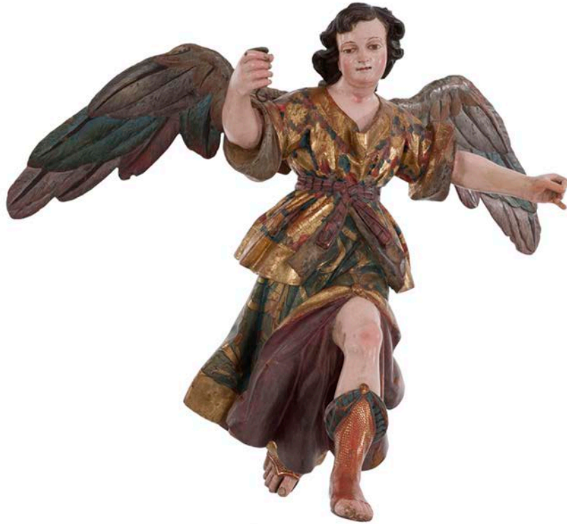
Imatge 3 (vista frontal)

IMATGES 3 i 4. Àngel turiferari, primera meitat del segle XVIII. Talla en fusta policromada i daurada, 93 × 141 × 91 cm. Museu Nacional d'Art de Catalunya (MNAC), Barcelona.