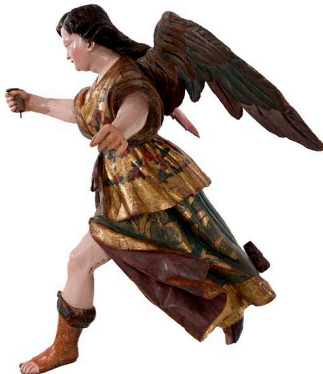
Imatge 4 (vista lateral)