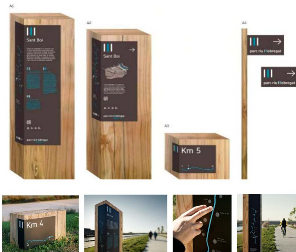
IMATGE C. Fotografies de la senyalització del Parc Riu Llobregat