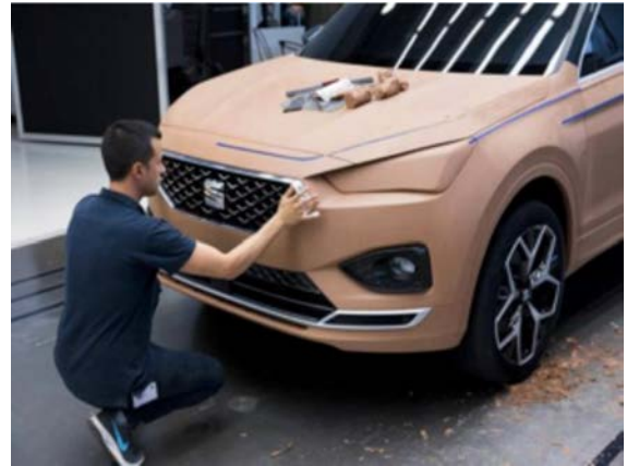
IMATGE B. Modelatge de prototips exteriors a SEAT

Responeu UNA de les dues qüestions següents: