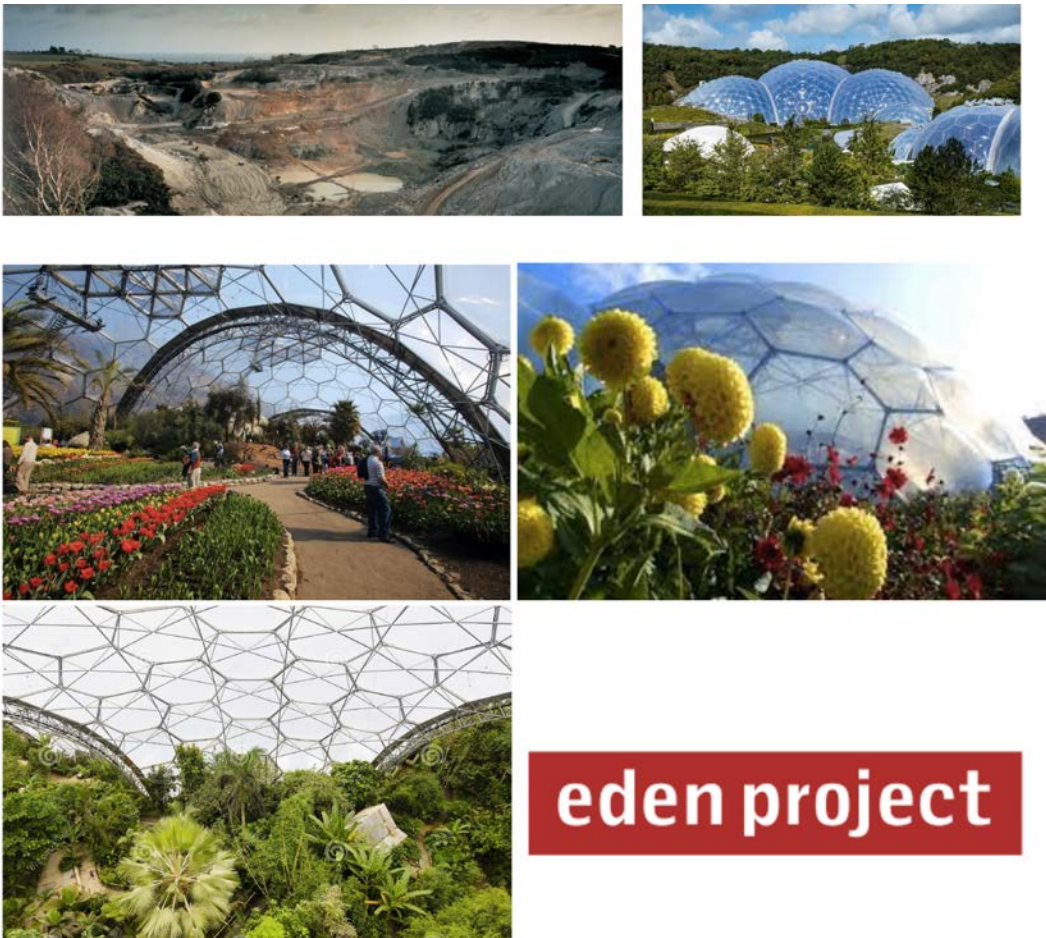
IMATGE H. Fotografies i logotip d'Eden Project, projecte dissenyat per Nicholas Grimshaw. Península de Cornualla, Regne Unit

El repte per a aquest projecte va ser dissenyar els edificis que proporcionessin l'entorn adient per a crear els diferents microclimes. Les cúpules estan construïdes amb una estructura de tubs d'acer galvanitzat que forma una sèrie d'hexàgons, pentàgons i triangles de diferents mides connectats, de manera que es crea una esfera coberta de panells.