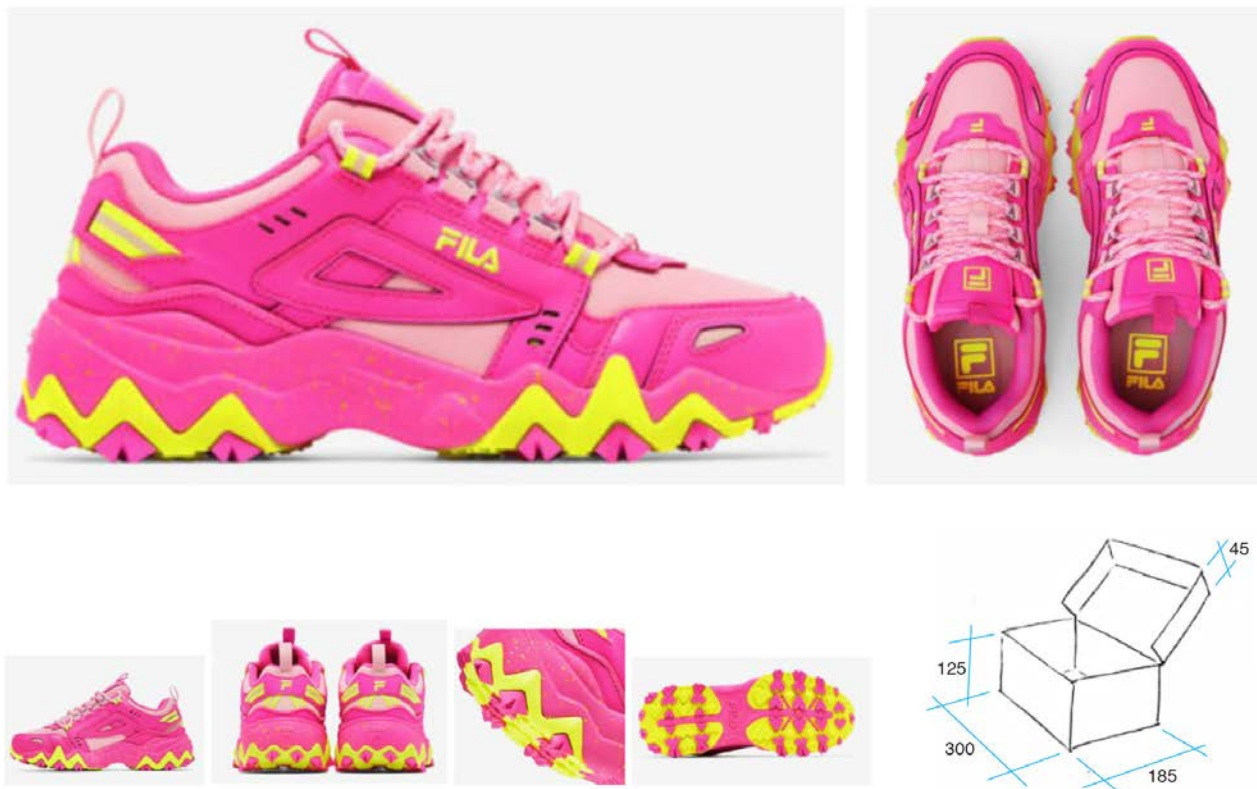
IMATGE F. Model de sabatilla OAKMONT TR. Vistes generals i de detall. A baix a la dreta, croquis de les mides de la capsa de cartonnet

Dissenyeu la imatge gràfica d'una capsa amb les mateixes mides i el mateix material (cartonnet) per a un nou model de sabatilla esportiva, el model que es mostra a la imatge F.