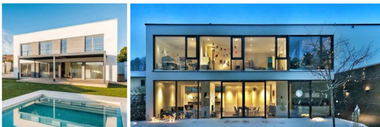
IMATGE A. Habitatges passius amb la certificació del Passivhaus Institut. Madrid Arquitectura

Per a aconseguir aquesta eficiència energètica superior, alguns dels aspectes que cal tenir en compte són l'orientació i l'aïllament.