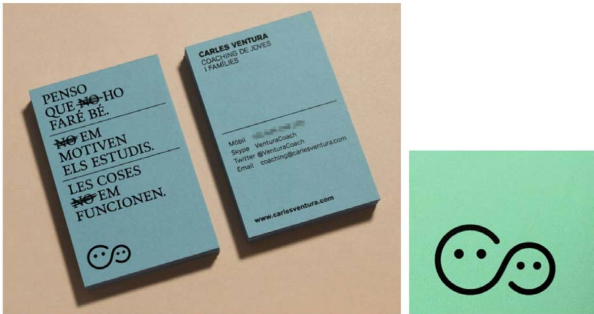
IMATGE D. Targeta de visita i imatge gràfica de Carles Ventura, dissenyades per Cómo

Cómo, un petit estudi de disseny de Barcelona, va fer el disseny de les targetes de visita i de la imatge gràfica de Carles Ventura, un orientador de joves i famílies. A la imatge D podem observar que la imatge gràfica representa dues persones connectades, un adult i un nen, units, l'un al costat de l'altre.