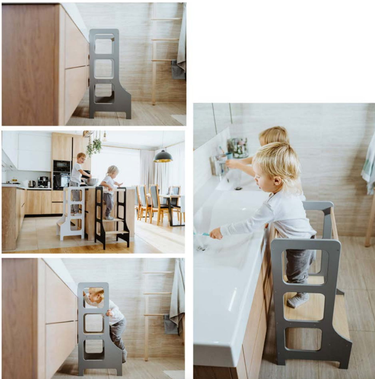
IMATGE E. Torre d'aprenentatge de Duck Woodworks

Aquesta torre els permet dur a terme tasques com ara ajudar a cuinar o rentar-se les mans d'una manera autònoma i segura. Les dimensions de la torre són 90 cm d'alçària, 40 cm d'amplada i 42 cm de fondària.