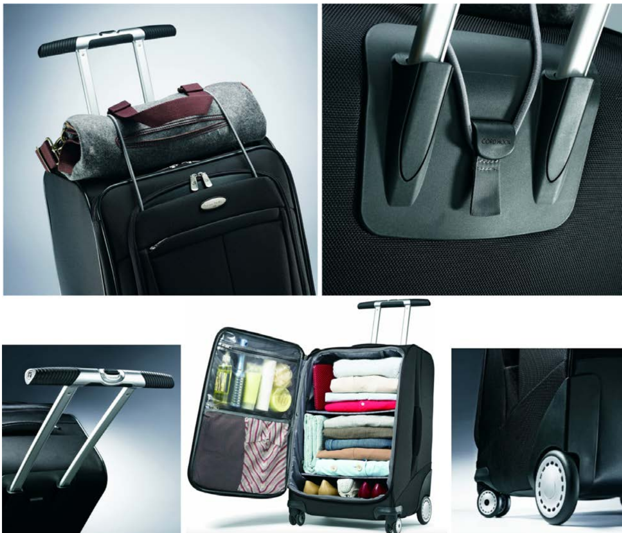
IMATGE B. Model EZ Cart de Samsonite

En les fotografies de la imatge B, podem observar diferents detalls del model EZ Cart d'aquesta marca.