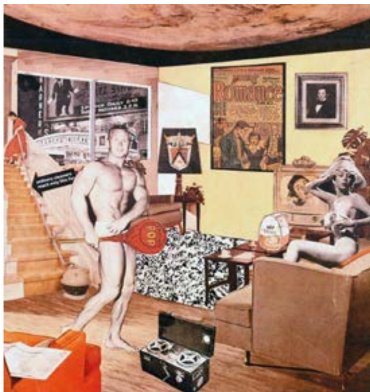
Richard Hamilton. Just What Is It That Makes Today's Homes So Different, So Appealing? («Què és el que fa que les cases d'avui siguin tan diferents, tan atractives?») (1956). Collage , 26 × 24,8 cm. Col·lecció particular.

Observeu la imatge següent. Fixeu-vos també en l'any i el títol.