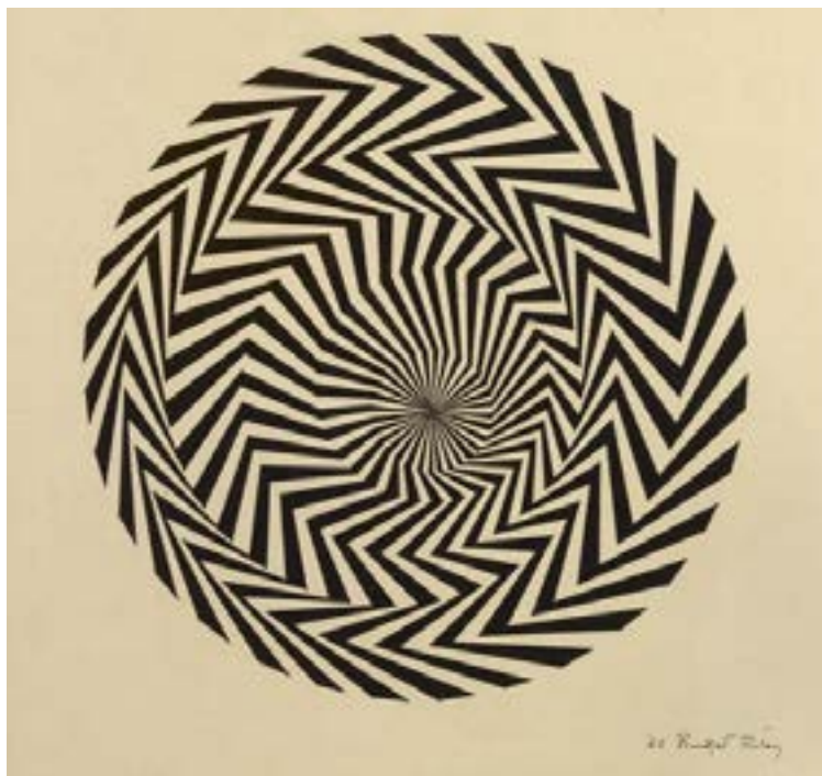
Bridget Riley. Blaze Study («Estudi de la resplendor») (1962). Tinta negra i collage , 60 × 50 cm. Museu Britànic, Londres, Regne Unit.

Observeu les imatges següents. Fixeu-vos també en l'any i el títol.