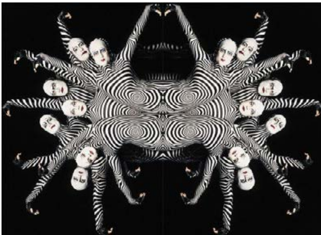
Acrobàcies elevant-se des de la superfície de l'aigua durant la producció O (pronunciació de la paraula francesa eau , que vol dir 'aigua') (2013), del Cirque du Soleil, dins de l'hotel Bellagio de Las Vegas, Nevada, Estats Units.