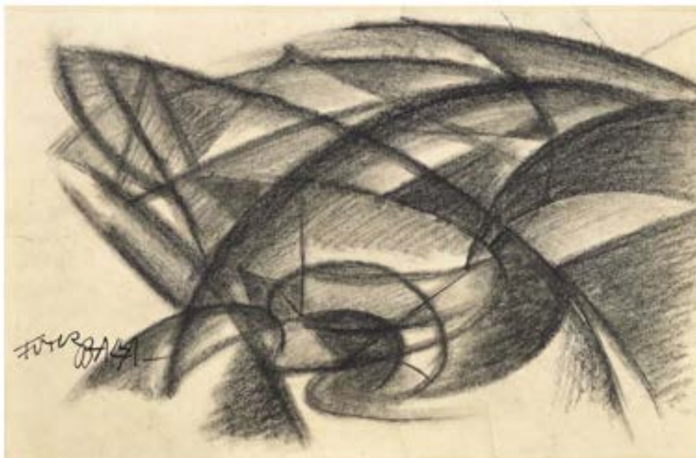
Giacomo Balla. Linee di velocità + vortice («Línies de velocitat + vòrtex») (1913-1914). Llapis Conté sobre paper, 18,5 × 28 cm.

Observeu atentament les imatges següents.