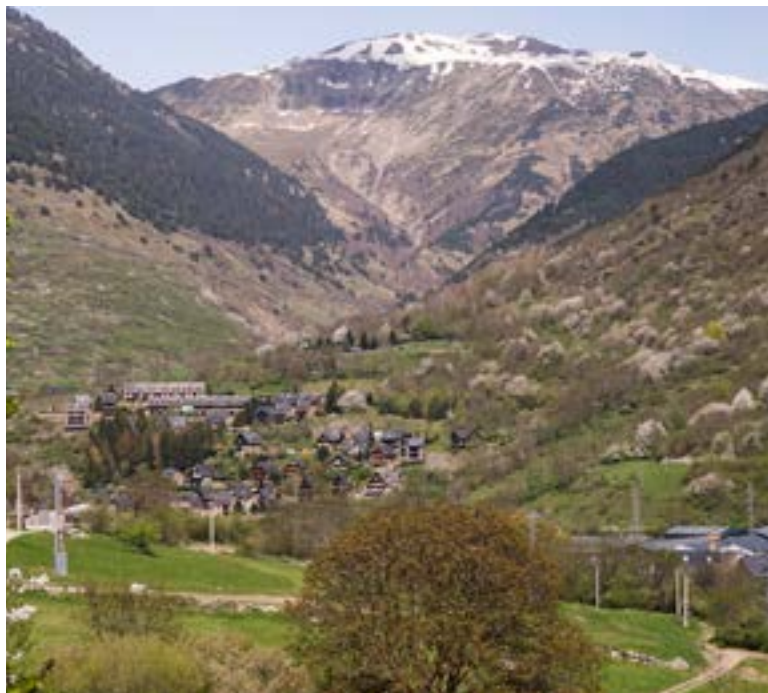
El paisatge dels Pirineus (Vilac, Vall d'Aran)