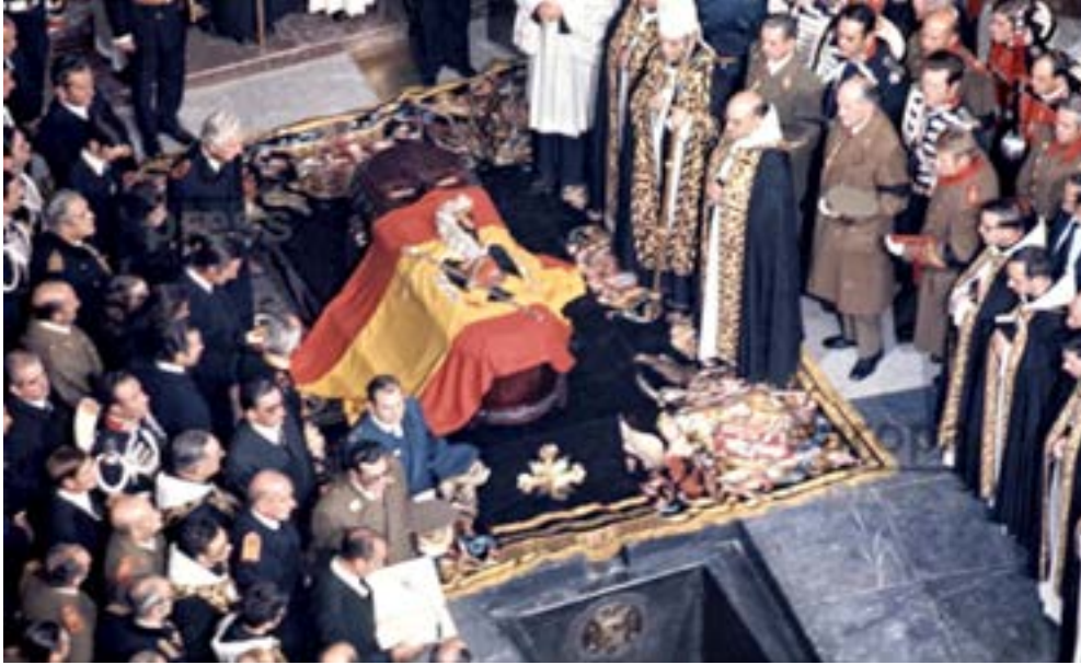
Basilica deth Valle de los Caídos, 23 de noveme de 1975.