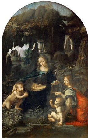
2. Leonardo da Vinci