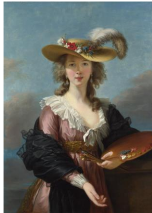
4. Vigée Le Brun

e) Ordeneu cronològicament, de més antiga (1) a més recent (4), les obres següents. Per fer-ho, escriviu els números corresponents a les caselles que hi ha a sota de les imatges. A continuació, anoteu els noms dels autors de les obres a la taula final segons si les obres pertanyen al Renaixement o al Barroc i el Rococó (Cal completar tota la seqüència temporal i emplenar la taula. En cas contrari, l'apartat no es puntuarà.)